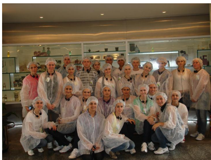
Figura: 02 – Em frente ao painel histórico do “O Boticário”

A implicação deste processo resulta em produção em grande escala e com padrão de qualidade.