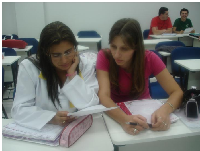
Figura: 04 – Realização da leitura das notícias

Quando perguntados sobre o que acharam da notícia que leram, a maioria das equipes 07 (sete), apresentaram como padrão de resposta “ que acharam interessante ”, outras 02 (duas) responderam que “ é uma notícia boa, só que não tem comprovação científica quanto à sua eficácia terapêutica. ”