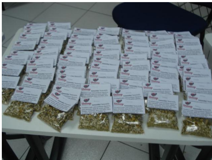
Figura: 07 – Sachês de camomila distribuído para a comunidade acadêmica

A Alcachofra foi representada pela Equipe 03: Os recursos utilizados pelos representantes foi dinâmico e criativo, exemplares da planta em diversas fases e formas, degustação da planta por meio de chás e a flor em forma de salada, sachês com a planta seca, cápsulas manipuladas, criaram 04 (quatro) vidros com conservantes e exemplares em fases diferentes da flor da alcachofra, os quais disponibilizaram para o laboratório de Botânica da instituição.