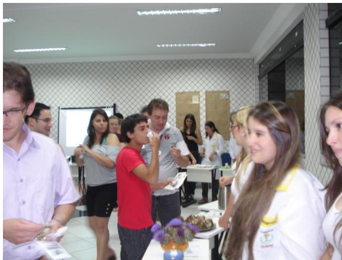
Figura: 09 – Estande expondo alcachofra

Outro atrativo da equipe foi à criação de um livro de receitas a base de alcachofra apresentando 17 (dezesete) receitas com a planta.