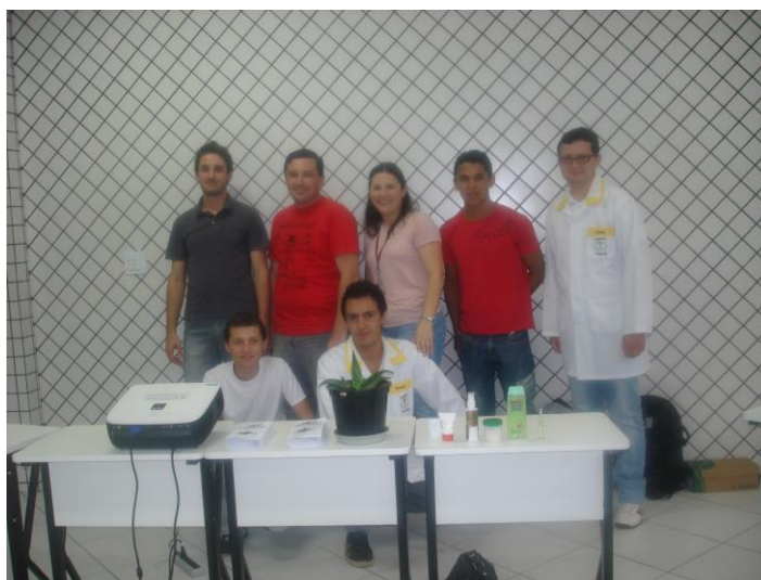
Figura: 06 – Equipe representando a Babosa

A equipe 01 representou a Babosa : Os recursos usados pela equipe para disseminar as informações sobre esta planta foi por meio de multimídia, exemplares da planta, produtos industrializados e a elaboração de um “ folder ”, (Apêndice F) com indicações e contra indicações do uso da referida planta, que foram distribuídos pelos integrantes de maneira a esclarecer as pessoas sobre o uso adequado desta planta.