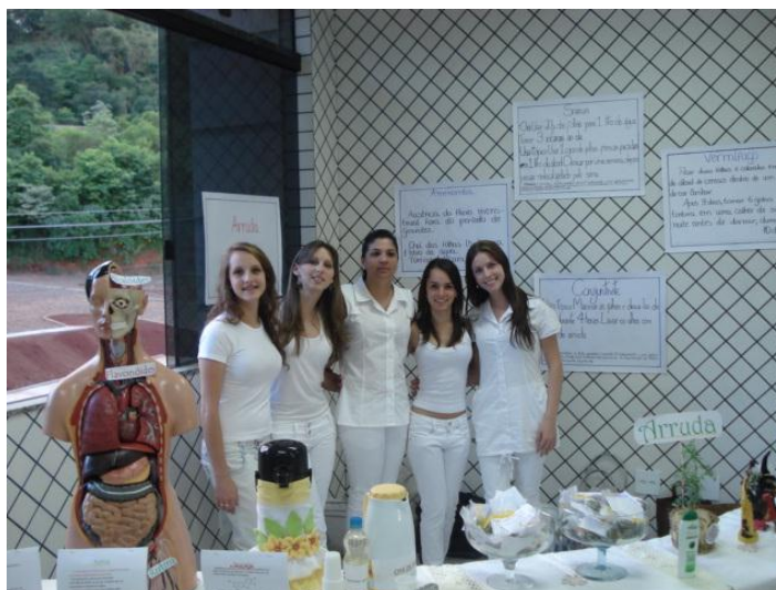
Figura: 10 – Equipe representando Arruda Fonte: Autora

Os recursos apresentados foram chás, saches com a planta seca, folders explicativos (Apêndice G), painéis informativos. Outro atrativo foi uma maquete com partes do corpo humano para mostrarem os pontos que ficam propensos a desenvolver alguma patologia pelo uso excessivo da planta.