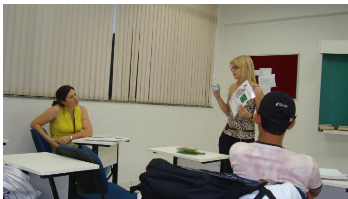
Figura: 05 – Apresentações individuais das plantas

Permitiu-se aos acadêmicos que realizassem as apresentações de suas pesquisas sobre o uso e o avanço de Tecnologias e Científicos relacionados à utilização de plantas na farmacologia, proporcionou-se que relatassem sobre a planta escolhida para ser pesquisada, conforme ( Figura 05 ).