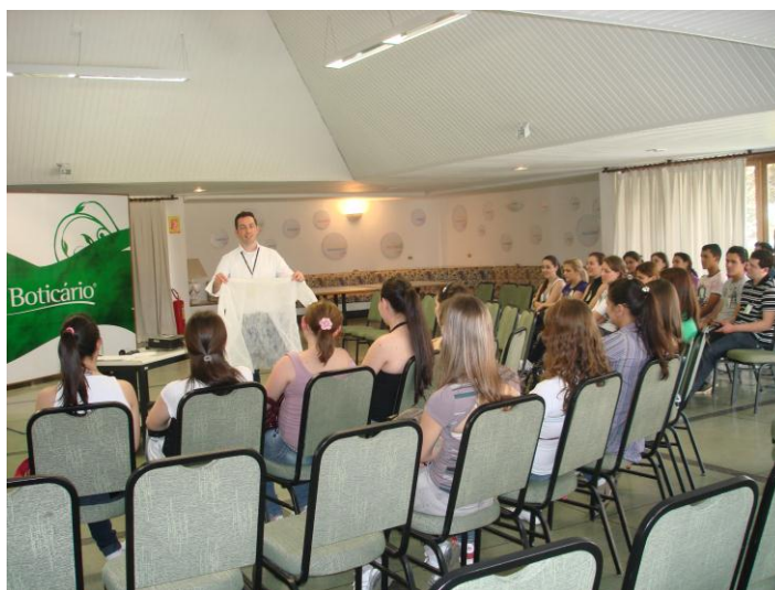
Figura: 01 – Explicações sobre procedimentos de visita na indústria “O Boticário”