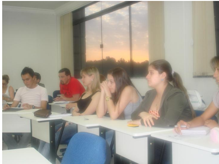
Figura: 03 – Grupo de observação para a discussão sobre ciência e tecnologia.