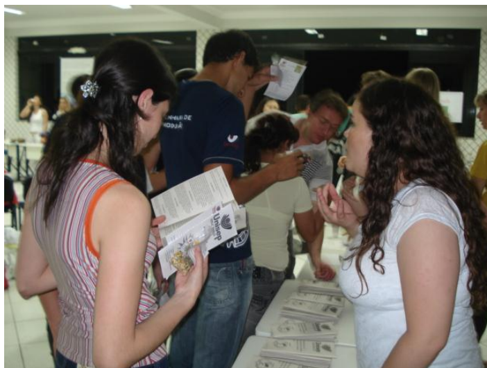
Figura: 11 – Momentos da entrega de folders e degustação vinho com dente de leão

O seminário final permitiu aos alunos uma visão geral da importância de todas as atividades desenvolvidas no decorrer da pesquisa para que eles pudessem realizar o trabalho final.