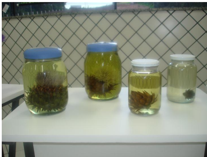
Figura: 08 – Exemplares da flor de Alcachofra conservados em álcool

A Alcachofra foi representada pela Equipe 03: Os recursos utilizados pelos representantes foi dinâmico e criativo, exemplares da planta em diversas fases e formas, degustação da planta por meio de chás e a flor em forma de salada, sachês com a planta seca, cápsulas manipuladas, criaram 04 (quatro) vidros com conservantes e exemplares em fases diferentes da flor da alcachofra, os quais disponibilizaram para o laboratório de Botânica da instituição.