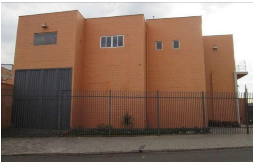
Figura 3 – Fundos do Galpão Industrial

A disposição interna da empresa foi pensada da seguinte forma: o primeiro andar compreenderá a área de processamento do alimento, com todos os equipamentos e cozinha e segundo andar abrigará a administração do empreendimento.