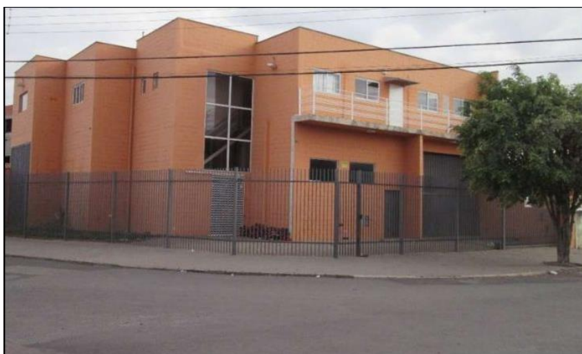
Figura 2 – Frente do Galpão Industrial proposto para a Empresa Fonte: Viva Real (2017).

A Figura 2 e a Figura 3 mostram o galpão onde será instalada a empresa.