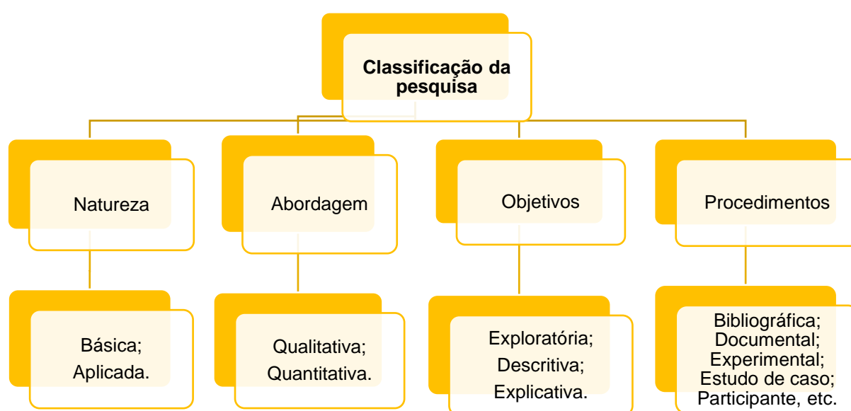
Figura 1: Classificação da pesquisa

A classificação da pesquisa, por sua vez, pode ser subdividida quanto a abordagem, quanto a natureza, quanto aos objetivos e quanto aos procedimentos. Na Figura 1 é possível ver um demonstrativo sobre a classificação da pesquisa de acordo com Gil (2008), Marconi e Lakatos (2008).