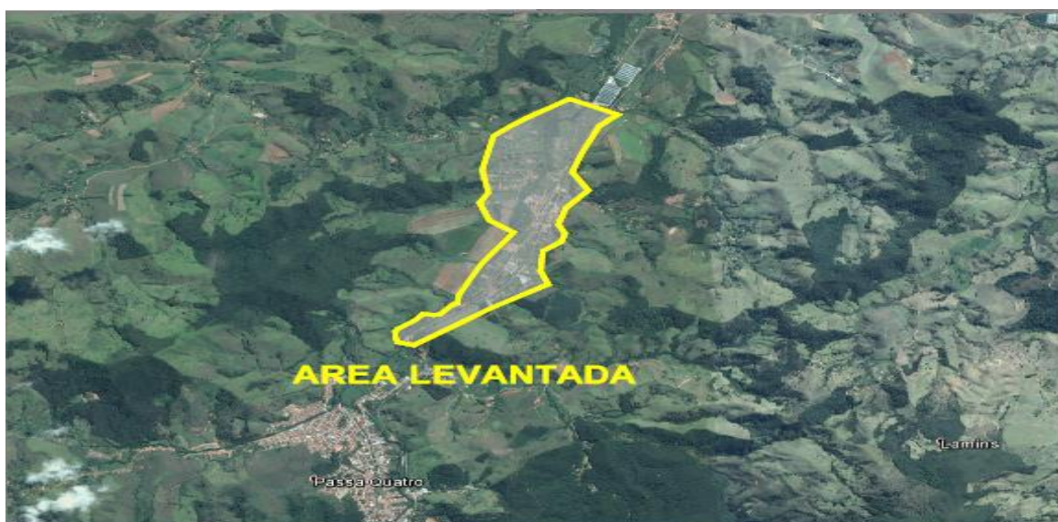
Figura 3 – Foto área do bairro tronqueiras, feita por drone.