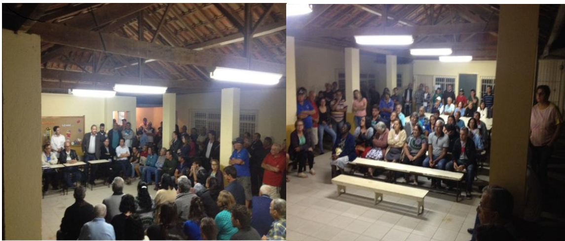
Figura 5 – Audiência pública em tronqueiras