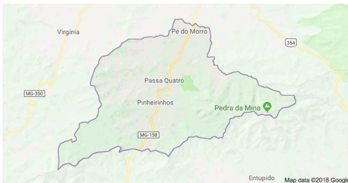
Figura 2 – Mapa de Passa Quatro

O município fica localizado na região Sul Mineira, num ponto estratégico, fazendo divisa com o Estado de São Paulo e tendo fácil acesso para o estado do Rio de Janeiro, ficando a 439,20 km da capital de Minas Gerais, Belo Horizonte. Possui uma área territorial de 276,568 km 2 , sendo considerada uma estância hidromineral e região turística. Conforme mostra figura 2: