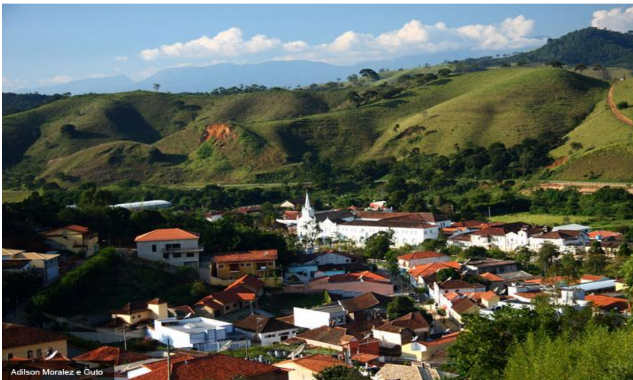
Figura 1 – Vista Geral de Passa Quatro