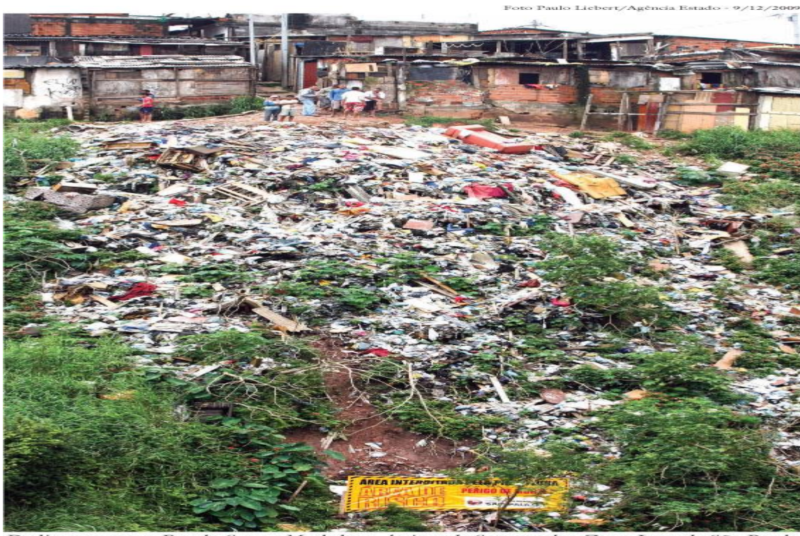
Deslizamento na Favela Santa Madalena, bairro de Sapopemba, Zona Leste de São Paulo.