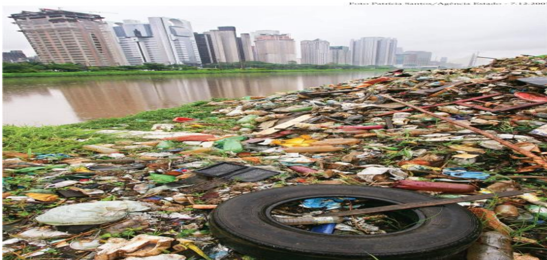
Lixo acumulado na margem do Rio Pinheiros, em São Paulo, em razão das chuvas.

Foto 1: Lixo acumulado nas margens do Rio Pinheiros em São Paulo.