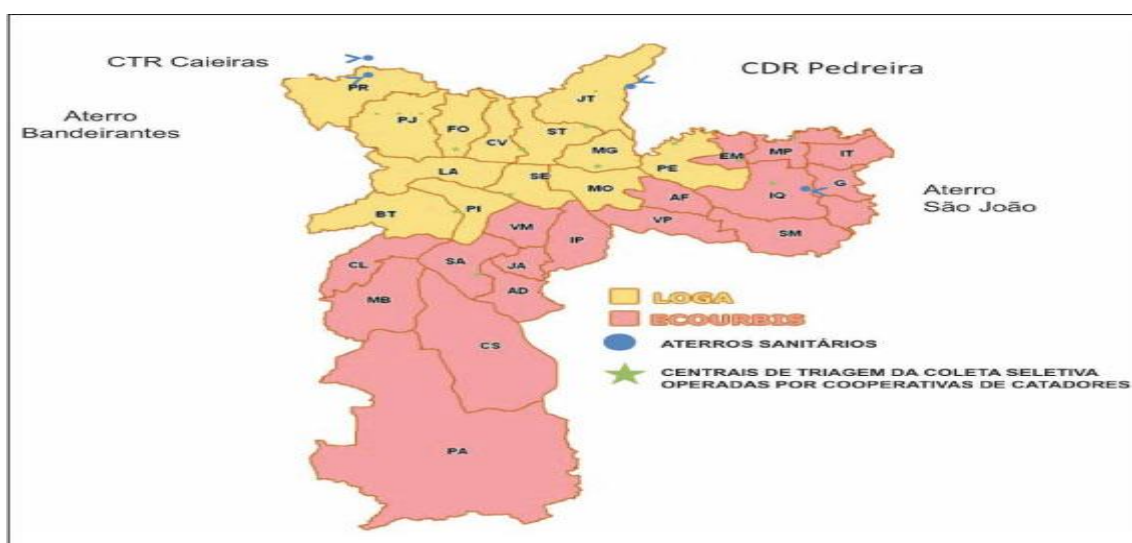
Figura 3 – Mapa de coleta resíduo domiciliares, serviços de saúde e materiais reciclados.