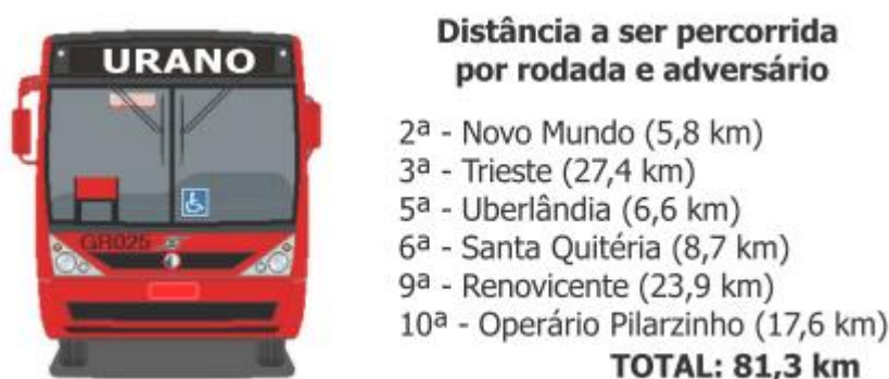
Figura 4: Distância a ser percorrida pelo clube Urano na 1ª fase da Suburbana 2014.

Em consonância ao trecho acima retirado do Guia da Suburbana 2016, Oliveira (2013) aponta que, se por um lado a Suburbana pode ser analisada a partir de sua interdependência com o futebol profissional, por outro, acompanhá-la permite a observação de um amplo aspecto de relações comunitárias. Para muitos moradores de Curitiba e Região Metropolitana a competição é uma atividade de lazer que promove um interessante trânsito de pessoas entre os bairros da cidade, conforme pode ser observado na ilustração abaixo que representa a distância percorrida pelo clube Urano no decorrer da primeira fase do campeonato de 2014.