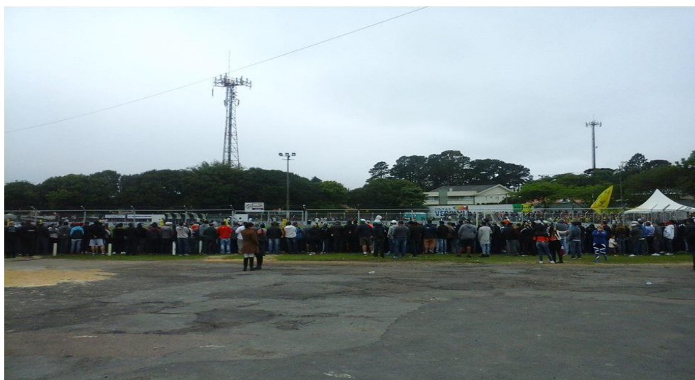
Figura 5: Torcida no Estádio Egydio Pietrobelli – 1º jogo da final da Suburbana 2016.

Na prática o que observamos é que os próprios estádios da Suburbana materializam esse modelo híbrido no qual ela se constitui. Todos os clubes precisam possuir os seus estádios murados, mas salvo algumas exceções, a maioria deles são caracterizados por estruturas bastante limitadas quando comparados aos clubes profissionais, o que permite por outro lado, uma maior apropriação do espaço, como é possível observar na figura 5, que corresponde a uma fotografia retirada de um dos jogos da decisão do campeonato em 2016 entre as equipes S.O.B.E Iguacu e Santa Quitéria.