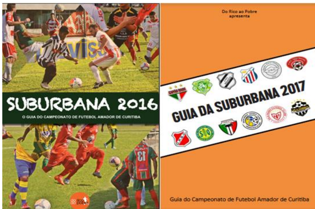
Figura 2: Guia Suburbana 2016/2017 - DRAP (Do rico ao pobre).