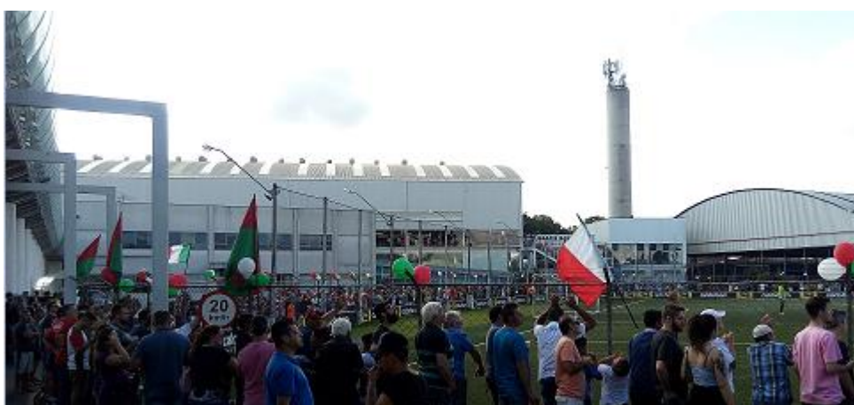
Figura 6: Torcida no Trieste Stadium - 2º jogo da final da Suburbana 2017.

Entretanto, apesar do clima festivo, cabe salientarmos que nos jogos decisivos as torcidas permaneceram separadas, principalmente como medida preventiva aos casos de violência que ocorreram em outros jogos da competição 56 . Contudo, não era incomum encontrarmos pessoas vestidas com camisas de diferentes clubes (tanto amadores quanto profissionais), demonstrando que, salvo determinadas exceções, o convívio entre os torcedores no contexto da Suburbana curitibana é pacífico.