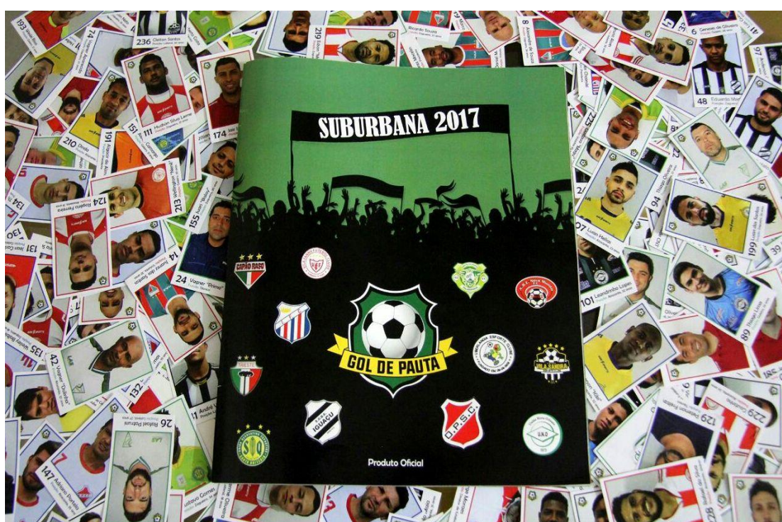
Figura 3: Álbum de figurinhas – Suburbana 2017.

Outro fator que contribui para a “popularidade” da Suburbana e que eleva a sua importância é a participação de equipes que representam clubes e regiões muito tradicionais da