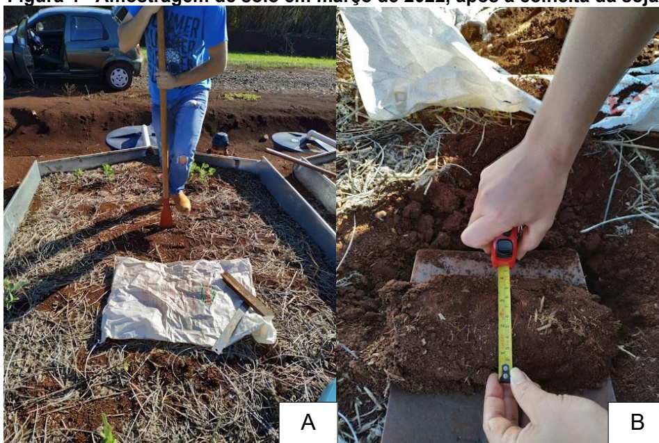
Figura 4 - Amostragem de solo em março de 2022, após a colheita da soja.

Legenda: A. Coleta do solo; B. Conferência da medida da amostra de solo .