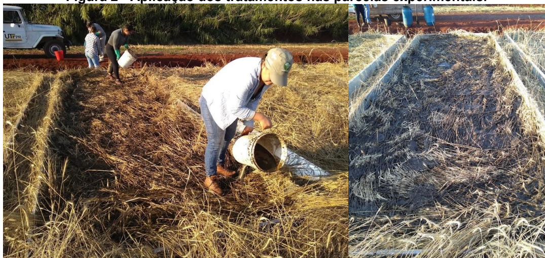
Figura 2 - Aplicação dos tratamentos nas parcelas experimentais.