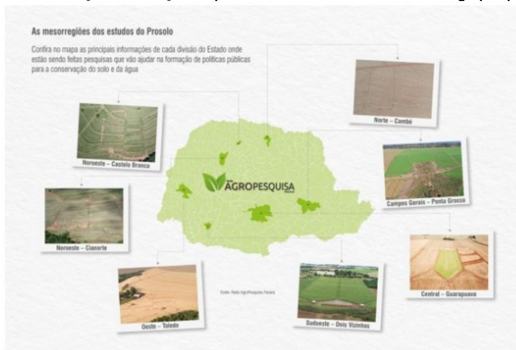
Figura 1 - Localização das estações experimentais da Rede Paranaense de Agropesquisa

Nas megaparcelas os manejos feitos nas plantações são os mesmos praticados em cada região afim de demonstrar a eficácia dos terraços para ajudar na contenção das chuvas e evitar a erosão em diferentes cultivos. O estudo inclui o monitoramento durante eventos de chuva e estudos de caracterização do solo, analisando fatores como porosidade e capacidade de infiltração, vazão e a turbidez da água.