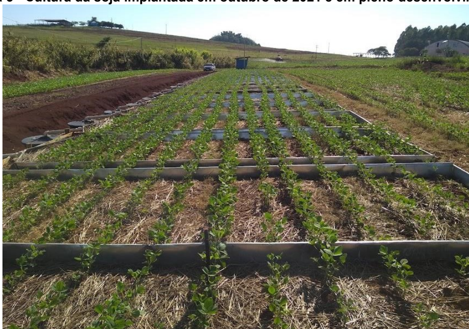
Figura 3 - Cultura da soja implantada em outubro de 2021 e em pleno desenvolvimento.

Em 22 de outubro de 2021 os tratamentos foram novamente aplicados e no mesmo dia implantou-se a cultura da soja, cultivar NS 5445. Neste dia também foram coletadas amostras dos resíduos orgânicos em garrafas pets para posterior análise. Em função da baixa germinação da cultura foi necessário a ressemeadura, que foi realizada dia 05 de novembro com a cultivar Pioneer 95Y02, de ciclo precoce, com população de 288 mil plantas por ha. No decorrer do desenvolvimento da cultura foram realizados os tratamentos fitossanitários de acordo com recomendações técnicas para a cultura.