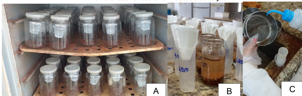
Figura 6 - Desenvolvimentos das análises microbiológicas do solo dos tratamentos sob diferentes fontes e formas de adubação

Legenda: A. Análise de respirometria; B. Análise de C e N microbiano; C. Análise de extração de esporos de fungos micorrízicos arbusculares.