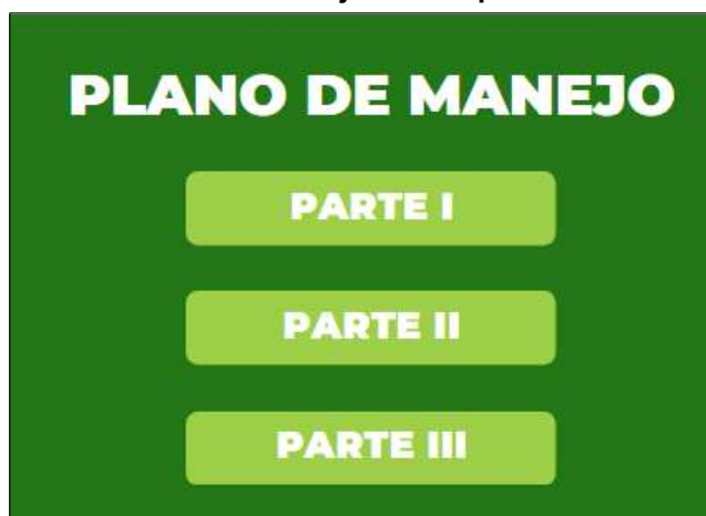
Figura 5: Encartes do Plano de Manejo do Parque Cinturão Verde de Cianorte/PR