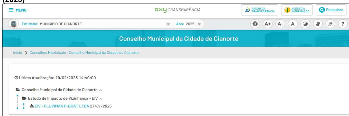
Figura 10: Página do Conselho Municipal da Cidade de Cianorte/PR no Portal da Transparência (2025)