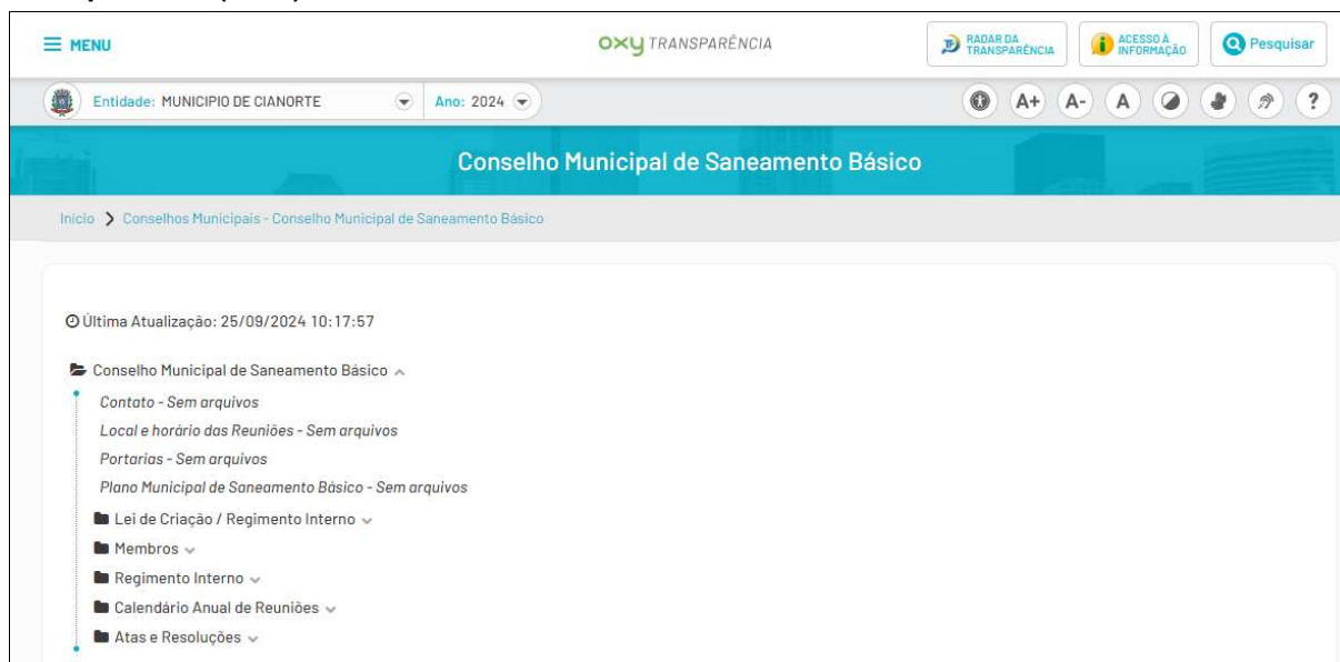
Figura 1: Página do Conselho Municipal de Saneamento Básico de Cianorte/PR no Portal da Transparência (2024)