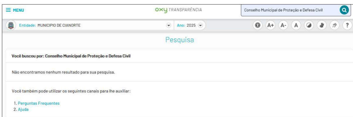
Figura 7: Busca feita no Portal da Transparência de Cianorte/PR, em 18 de fevereiro, por “Conselho Municipal de Proteção e Defesa Civil (fevereiro de 2025)”