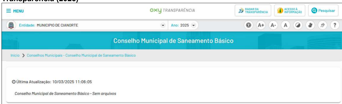
Figura 2: Página do Conselho Municipal de Saneamento Básico de Cianorte/PR no Portal da Transparência (2025)