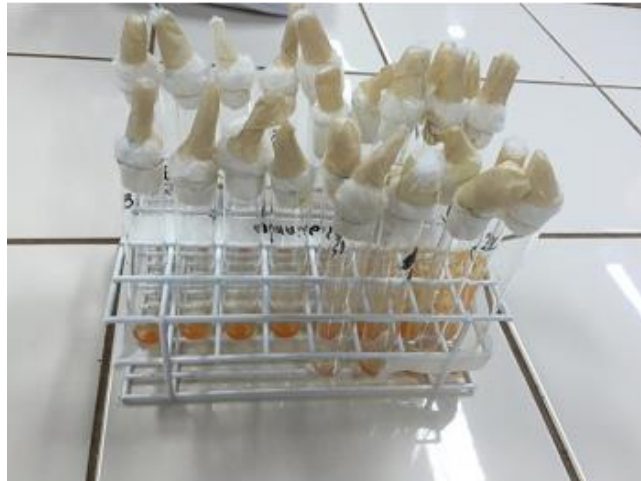
Figura 1. Concentração de inibição mínima (CIM)

contados em Câmara de Newbauer. O inóculo foi diluído para uma concentração final de 10^4 esporos/ml, o qual foi utilizado para a determinação da CIM. Esse procedimento foi realizado para cada um dos isolados.