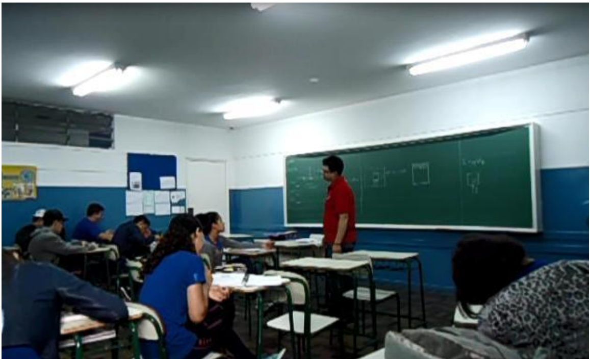
Figura 7. Último dia de aula.