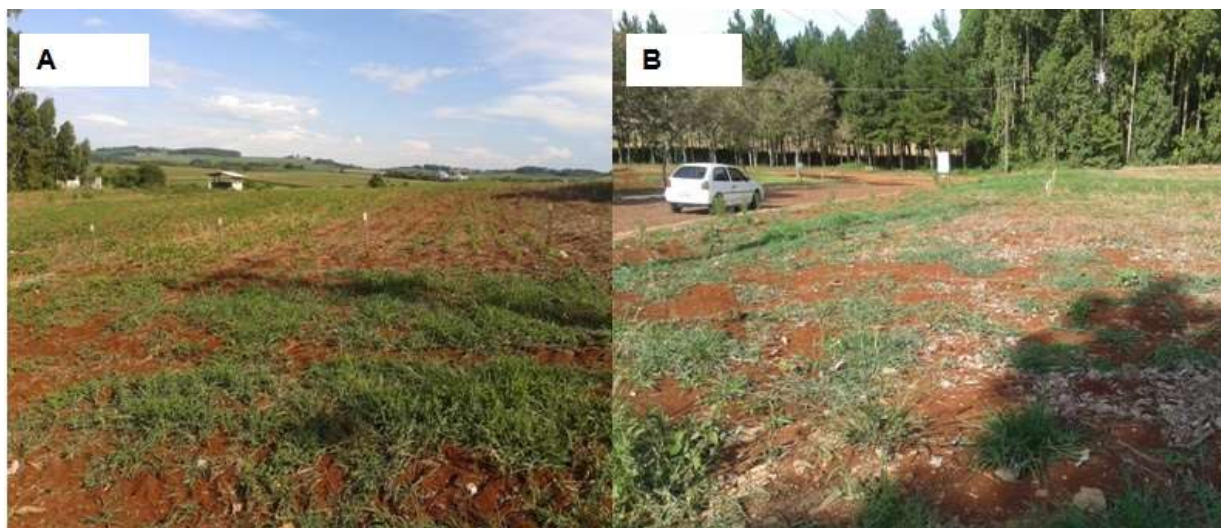
Figura 4. Sendo A: vista panorâmica do plantio convencional e B: vista da área de plantio convencional desnuda de cobertura vegetal morta, UTFPR - Dois Vizinhos.