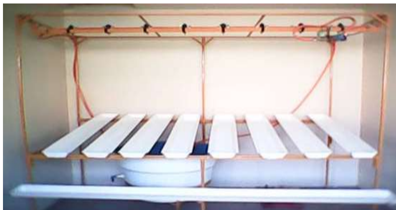
Figura 7. Vista frontal do simulador de erosão de solos.