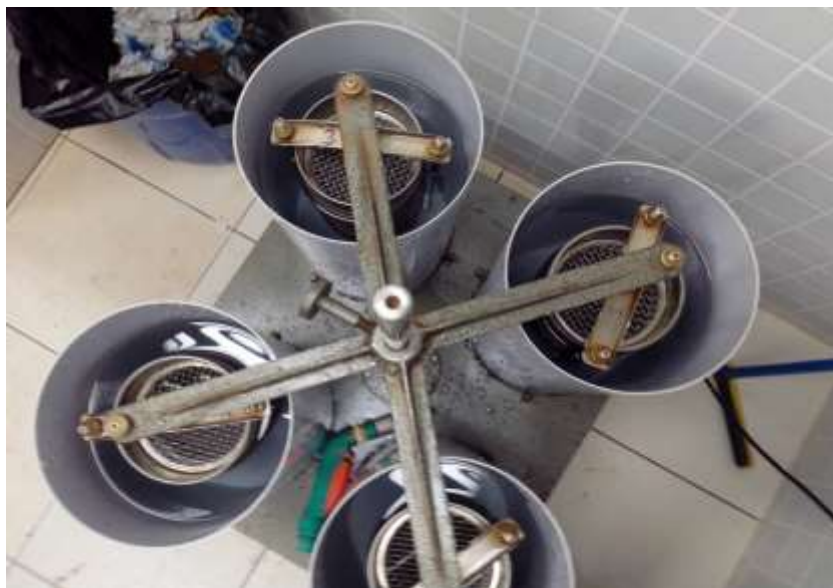
Figura 6. Vista do conjunto de peneiras do aparelho de oscilação vertical graduado.

As avaliações das perdas de sedimentos foram realizadas num simulador de erosão com oito calhas simultâneas (Figura 7) as quais foram distribuídas sob uma bancada com 30° de inclinação (BRANDELERO; LINK; MODOLO, 2013, p.359) e com intensidade de chuva de 59,2 mm/h. As amostras de solo dos respectivos tratamentos foram dispostas sobre as oito calhas, sendo quatro repetições com cobertura morta e quatro repetições sem cobertura morta para cada tratamento, sendo a quantidade de cobertura morta sobre os sistemas de uso iguais e, o volume de solo utilizado em cada calha de aproximadamente 0,0094531 m 3 . Os sedimentos foram coletados em quatro intervalos de tempos, sendo eles 10, 15, 20 e 25 minutos após dar início à chuva simulada. Os sedimentos foram quantificados através da técnica do Cone Imhoff (SOJKA; CARTER; BROWN, 1992, p.885) o qual apresenta o volume de sedimentos erodidos em mililitro por litro de água escoada, sendo esta composta pela mistura de água mais solo, considerando os tratamentos com cobertura morta (CCM) e sem cobertura morta (SCM).