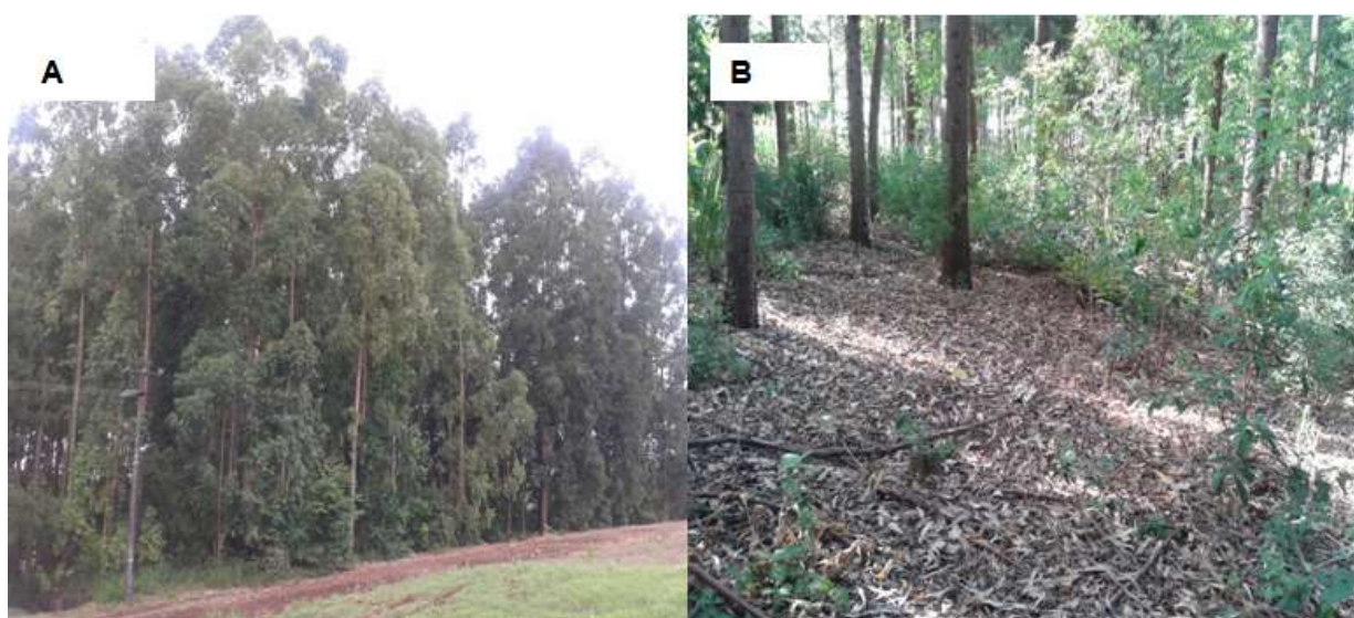
Figura 1. Sendo A: vista panorâmica do plantio florestal de Eucalyptus spp. e B: vista da cobertura vegetal morta da espécie, UTFPR - Dois Vizinhos.

Se tratando do sistema plantio direto (Figura 5), esta área também já foi cultivada a mais de 15 anos, onde se planta milho, soja e culturas de inverno. Nesta o preparo do solo não se dá de forma intensiva, com revolvimento mas, usando da tecnologia da semeadura direta. Localiza-se nas coordenadas UTM: 0289721 e 7156015 metros.