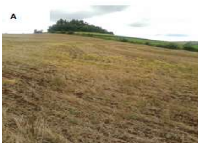
Figura 5. Sendo A: vista panorâmica do plantio direto e vista da cobertura vegetal morta no sistema de uso, UTFPR - Dois Vizinhos.