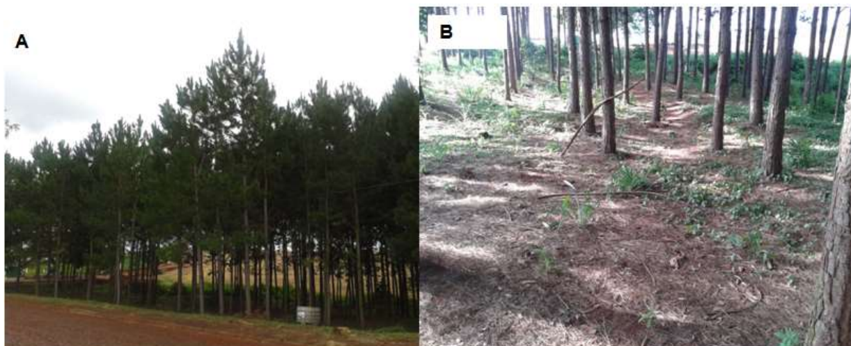
Figura 2. Sendo A: vista panorâmica do plantio florestal de Pinus taeda e B: vista da cobertura vegetal morta da espécie, UTFPR - Dois Vizinhos, 2014.