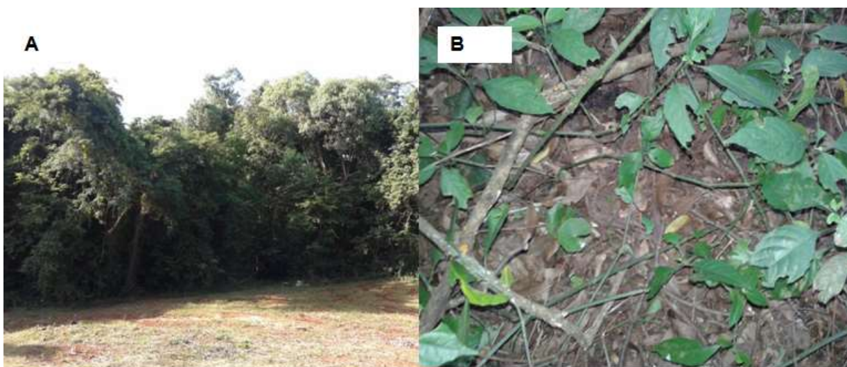
Figura 3. Sendo A: vista da entrada para a mata nativa e B: vista da cobertura vegetal morta da espécie, UTFPR - Dois Vizinhos.