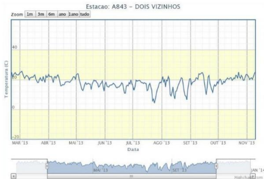
Figura 1. Dados de temperatura (°C) da estação meteorológica da UTFPR campus Dois Vizinhos dos meses de março a novembro de 2013.

Na Figura 1 são apresentadas as informações de temperatura (°C) da estação meteorológica da UTFPR, campus Dois Vizinhos, dos meses de março a novembro de 2013. Observando o período do experimento, abril a setembro, nota-se que as temperaturas foram mais altas nos meses de abril e começo de maio.