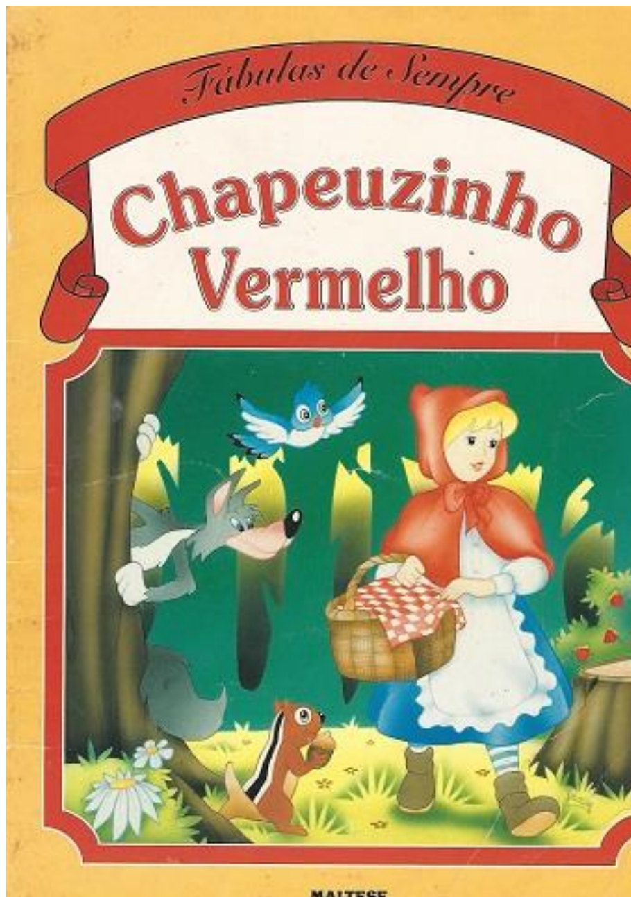
FIGURA 1 – Edição utilizada para análise – Chapeuzinho Vermelho - Editora MALTESE

A seguir, a capa do livro Chapeuzinho Vermelho que foi utilizado para a análise.