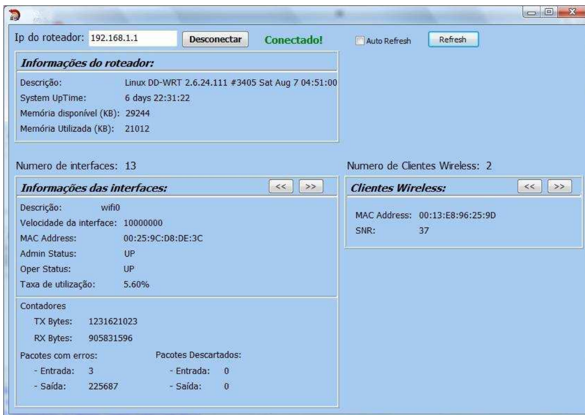
Figura 1 – Tela do software de monitoramento.

Ao se conectar a um equipamento com o serviço SNMP habilitado e o sistema correto o software automaticamente vai buscar várias informações sobre o roteador, como mostra a figura 1.