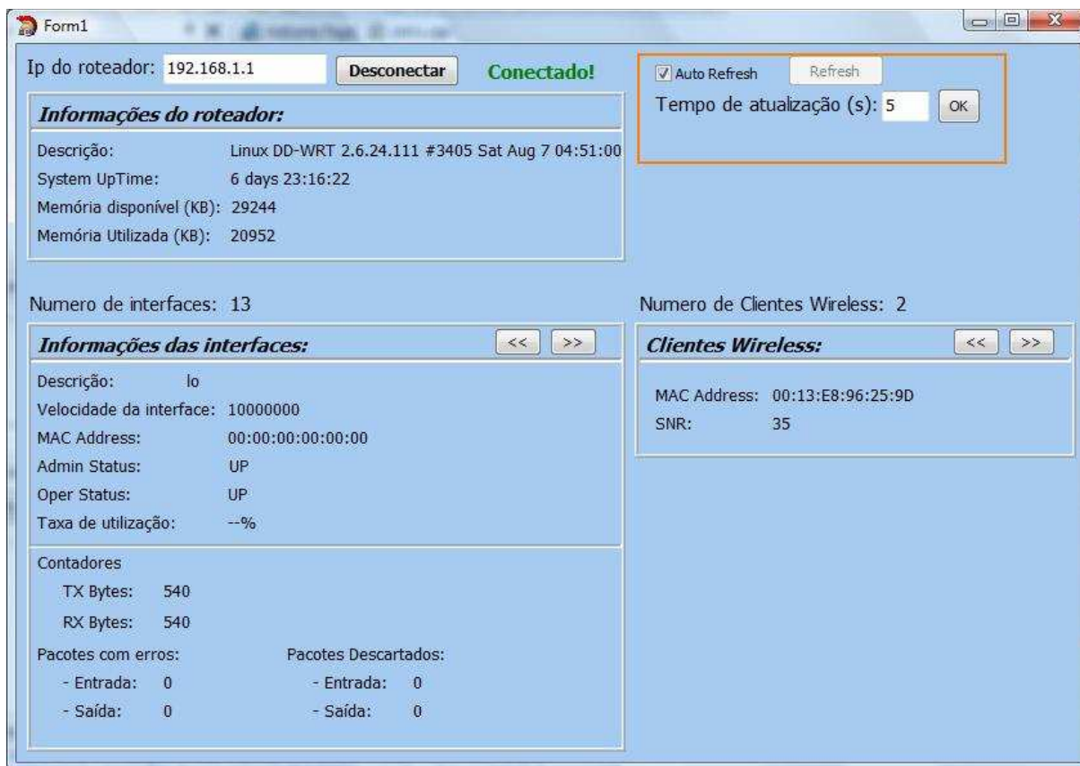
Figura 3 – Tela do software, com destaque para o tempo de atualização.