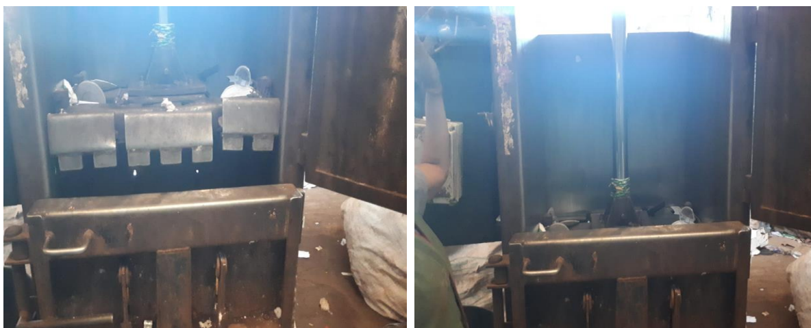
Figura 7 - Processo da Prensa do Material

É nesse momento em que há a ocorrência do risco de maior severidade, onde o operador da máquina pode acessar as partes moveis sem interferência de dispositivos de segurança (inexistentes). Risco tão iminente que no momento da análise, teve-se que intervir para que o operador não sofresse um acidente, tendo que pedir para que o mesmo tirasse o membro superior do vão entre o deposito de lixo e a prensa para que o mesmo não sofresse serias lesões