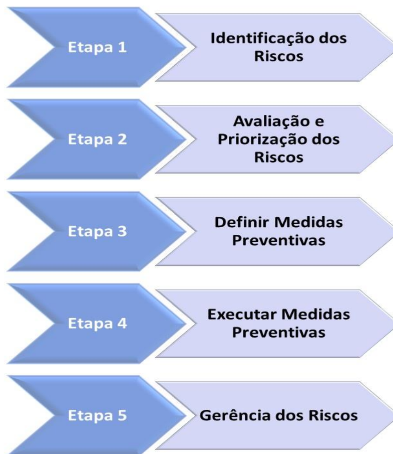
Figura 2 - Etapas da avaliação de risco

Cabral (2012) apresenta uma avaliação de risco mais sucinta, abordando somente as etapas 1 e 2 (Figura 1), assim somente a fase de perícia e conclusão dos riscos identificados em ambientes de trabalho são estudados. O método é definido pelas seguintes etapas: