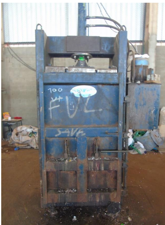
Figura 6 - Vista traseira da Prensa