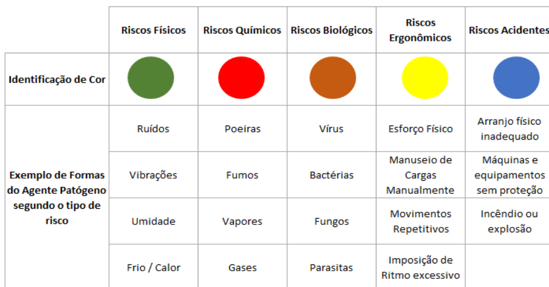
Figura 1 - Mapa de Risco para Coletores de Lixo

O trabalho do gari pode ser considerado um dos mais arriscados e insalubres, pois essa profissão está em contato direto com agentes nocivos à saúde, suas tarefas são também realizadas em ritmo acelerado, e quase sempre, em vias de tráfego intenso, colocando-o em risco por agentes mecânicos, como atropelamentos, quedas, esmagamentos pelo compactador e fraturas (NEVES, 2003).