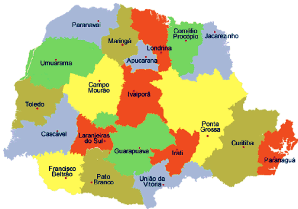
Figura 8 – Localização Geográfica do Município de Paranaíba

A Figura 8 ilustra a localização do Município de Paranaíba dentro do estado do Paraná.