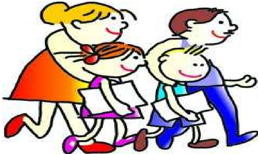
Figura 4 – Ilustração: Papel da Família