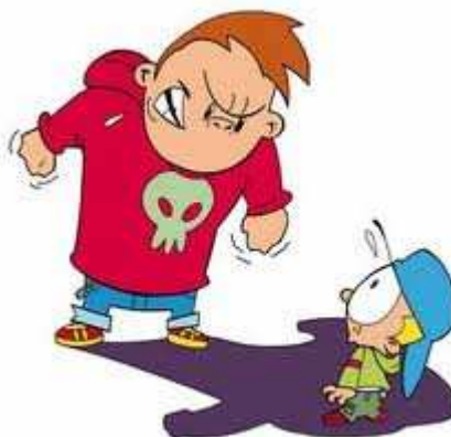
Figura 6 – Ilustração: Violência Gerada pela Indisciplina