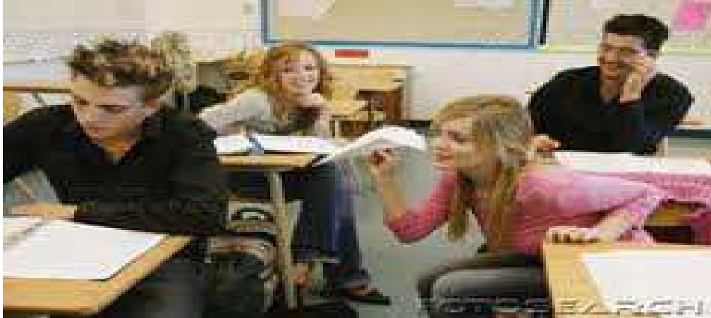
Figura 1 – Ilustração de Comportamento Indisciplinado