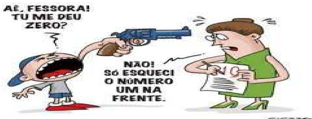
Figura 2 – Ilustração: Educador Amedrontado pela Indisciplina e Violência

O educador precisa estar consciente de seu papel, de seu compromisso com a educação, de suas responsabilidades, deveres e direitos; e assim buscar orientação, capacitação para desempenhar seu trabalho satisfatoriamente, alcançando os resultados positivos. Cabe a escola promover essa capacitação, mas não aquelas em que se reúnem o corpo docente e se organizam palestras cansativas e além do diploma não sobra vestígio algum dali alguns meses.