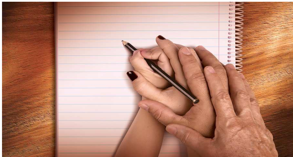
Figura 7 – Ilustração: A Educação Acontece em Conjunto

“desenvolver no aluno valores humanos imprescindíveis para a sua boa formação, tais como: disciplina, respeito, capacidade de trabalho, iniciativa, honestidade, cidadania, ética, moral, conhecimento das diferenças individuais, educação para o convívio social, amor, gratidão, humildade, trabalho em grupo ou equipe etc., assim como servir de mediador no processo de desenvolvimento de suas habilidades e competências.” (VILLELA, 2007)