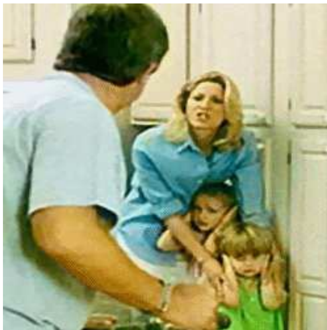
Figura 5 – Ilustração: Falta de Estrutura Familiar