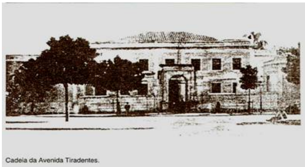
Figura 2 – Cadeia da Avenida Tiradentes

ocorrida no país a partir de 1964, o presídio serviu também prisão aos primeiros opositores do regime militar. Em função do início das obras do Metrô em 1972, o edifício foi demolido (SAP, 2015). Na figura 2 abaixo é demonstrado como a unidade era: