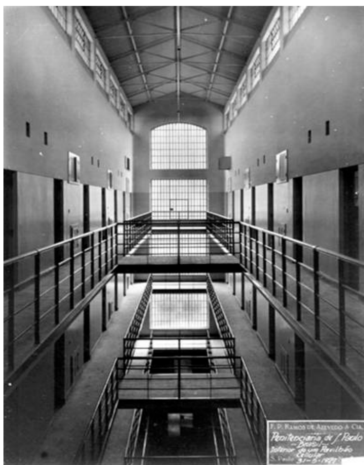
Figura 1 - Vista interna Penitenciária do Estado

As prisões que abrigam os detentos seguem determinações legais e apresentam formas de penas privativas de liberdade quando aplicadas da maneira correta. Desta forma, foram construídas lugares em formas de casarão, com duas funções, a primeira de ser Cadeia Pública e a segunda como Câmara Municipal, e depois, a partir do Código de 1890, as construções em formato espinha de peixe, pavilhonar, panóptico e os Institutos Penais Agrícolas apresentaram uma linha evolutiva de projetos de arquitetura penitenciária celular. Casarões e edificações celulares irão se tornar os modelos compactos dos dias atuais (SAP, 2015), conforme figura 1: