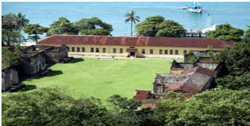
Figura 3 – Ruínas do Presídio Ilha Anchieta