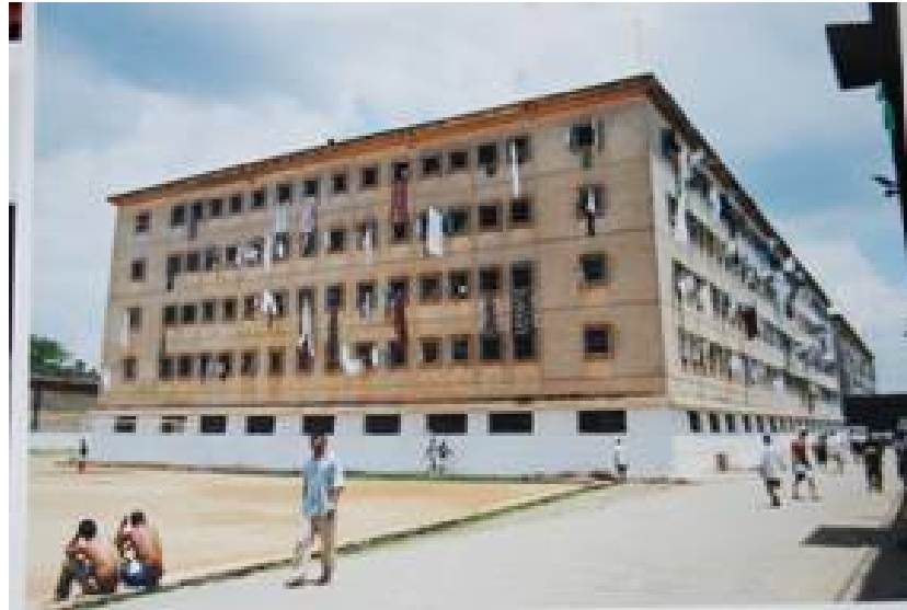
Figura 4 – Penitenciária do Carandiru