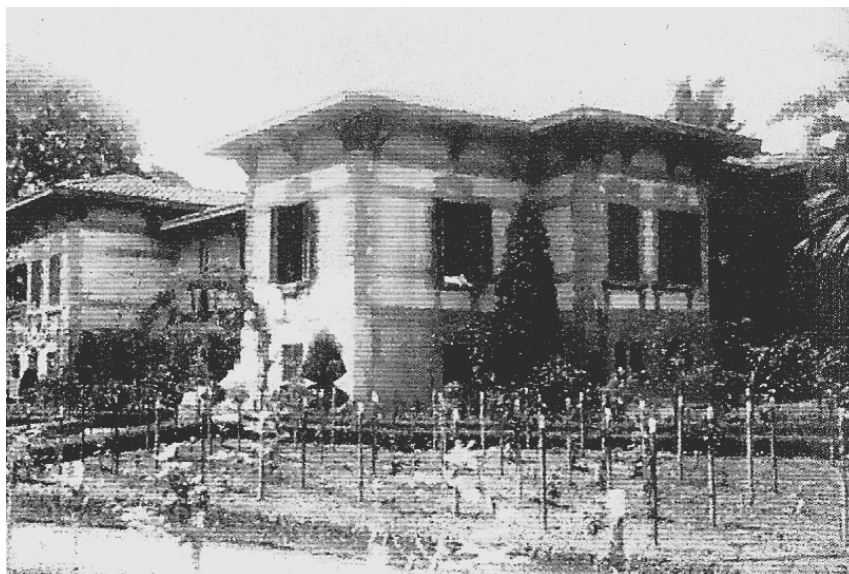
Figura 5 - Visão lateral da atual sede da Secretaria (década de 1930)

adequação com eficiência, pois dentro de um Estado democrático, onde o direito de punir é consequência da política social, a serviço de toda a sociedade, mas com princípios de penas mais humanas. Como decorrência dessa preocupação, a Lei nº 8209, de 04/01/93, criou e, o Decreto nº 36.463, de 26/01/1993, que organizou a Secretaria da Administração Penitenciária, a primeira no Brasil (SAP, 2016). Na figura 5 temos o primeiro prédio da SAP: