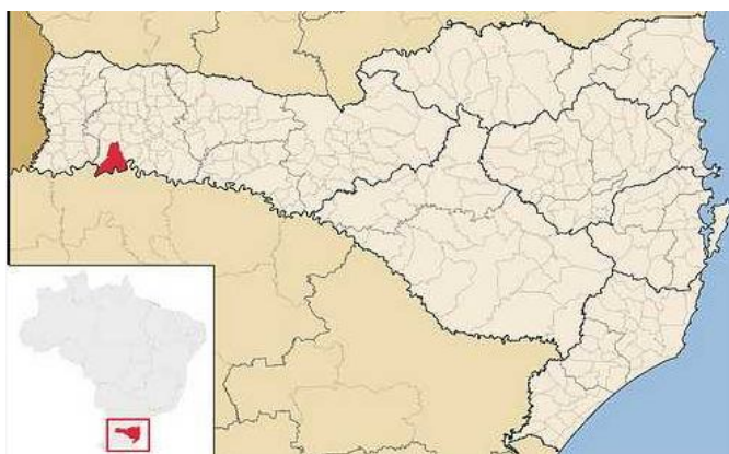
Figura 02: Localização Palmitos – Mapa Santa Catarina

O Município de Palmitos localiza-se no Estado de Santa Catarina, Mesorregião (Oeste Catarinense); Microrregião Chapecó, sendo Municípios limítrofes: São Carlos, Cunhataí, Cunha Porã, Caibi, Iraí (RS) e Alpestre. As características geográficas do município: são: Área 350,690 km 2 ; População: 16.021 habitantes (Censo IBGE/2010); Densidade 45,68 hab./km 2 ; Altitude: 406 m., Clima Subtropical úmido, e Fuso horário UTC-3. Indicadores IDH: 0,799 médio (PNUD/2000), PIB R$ 372 871,911 mil (IBGE/2008) e PIB per capita de R$ 22 520,50 (IBGE, 2008, citado por PREFEITURA MUNICIPAL DE PALMITOS, 2013). A Figura 2 apresenta a localização do município de Palmitos no estado de Santa Catarina.