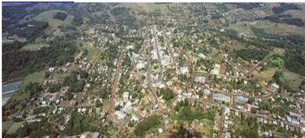
Figura 03: Vista Aérea Cidade de Palmitos (SC)

A Figura 3 apresenta a vista aérea Cidade de Palmitos (SC).