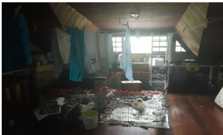
Figura 1 – canil clandestino em Curitiba-PR.

sobre fabricação canina em: SORIANO, Vanessa Souza. Seleção Artificial e o Bem-Estar de Cães. SB RURAL. 2014.