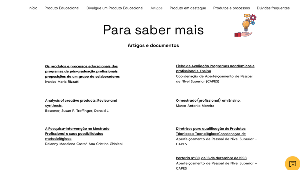
Figura 3 – Página de divulgação de artigos

No menu “Artigos” (Figura 3) o usuário é direcionado para uma página com uma seleção de artigos relacionados ao Mestrado Profissional e ao Produto Educacional.