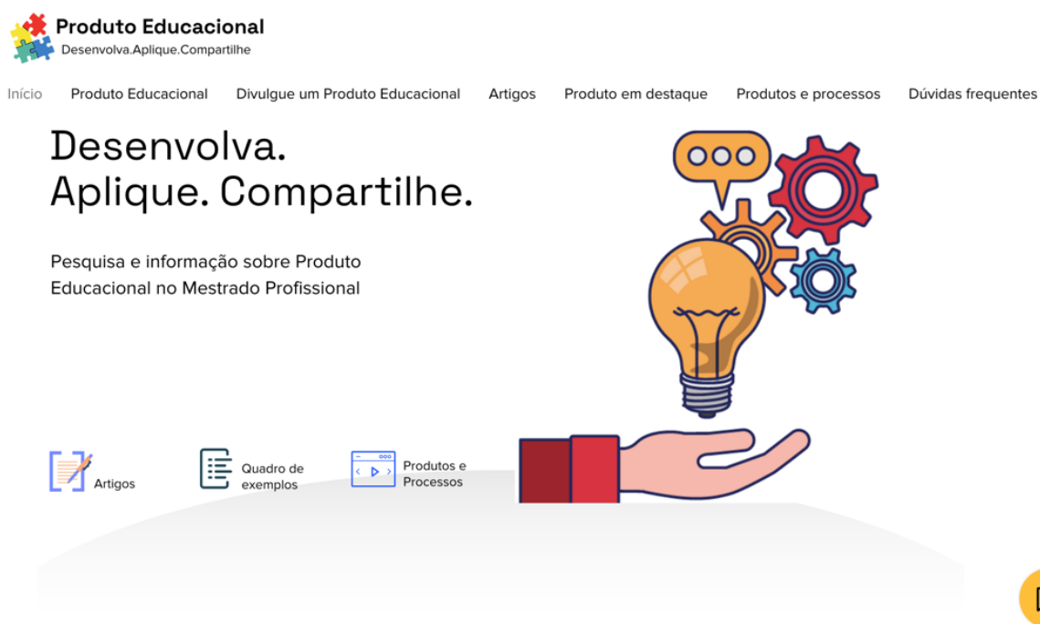
Figura 1 - Página inicial

A organização do menu e dos elementos gráficos foi pensada para que o usuário possa navegar com facilidade e fluidez. O layout (figura 1) foi organizado de forma que a navegação seja intuitiva e não gere dificuldades aos usuários na busca das informações.