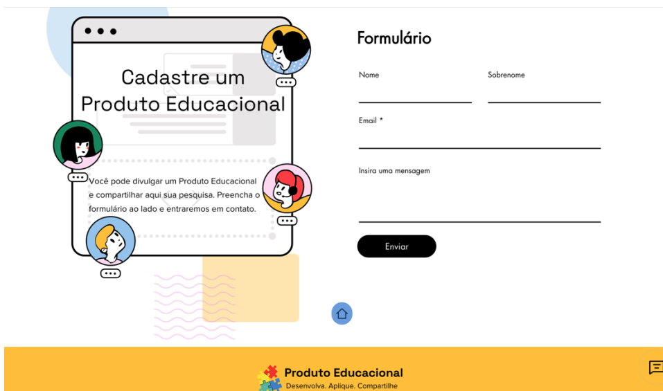
Figura 2 – página de divulgação de produtos educacionais

As sugestões de produtos, preenchida neste formulário, passam por uma avaliação, para que, em seguida, sejam compartilhados no site.