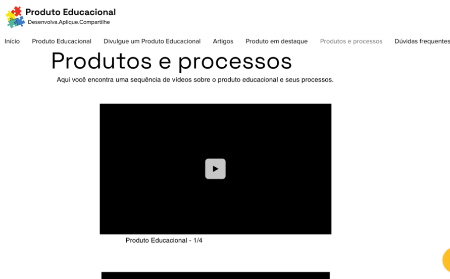
Figura 5 – Página de vídeos instrucionais

No menu “Produtos e processos” (Figura 5) são disponibilizados vídeos com informações sobre o processo de desenvolvimento do produto educacional.