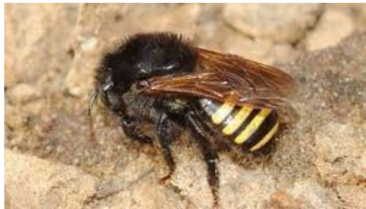
Figura 5 – Abelha Mandaguari ( Melipona quadrifasciata )

Essa espécie de abelha sem ferrão é endêmica do Brasil, especialmente encontrada na região nordeste do país. Também conhecida como "jandaíra" ou "uruçu-do-nordeste", é altamente valorizada por sua capacidade de polinização e pela produção de um mel de sabor diferenciado (COSTA et al. , 2020).