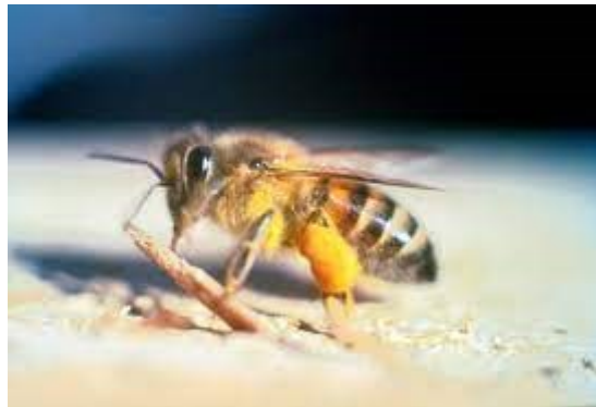
Figura 3: Abelha Africanizada ( Apis Melifera )

Também conhecida como "abelha africanizada" ou "abelha africana", é uma espécie híbrida resultante do cruzamento entre abelhas europeias e africanas. Elas são conhecidas por sua alta produtividade de mel, mas também por serem mais defensivas (MENEZES; MATTIETTO; LOURENÇO, 2018).