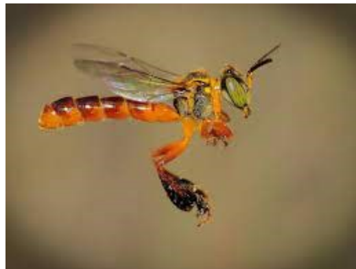
Figura 4 – Abelha Jataí ( Tetragonisca angustula ).

Uma abelha nativa do Brasil, também conhecida como "uruçu-amarela" ou "jataí-amarela". São abelhas sociais sem ferrão, muito importantes para a polinização de plantas nativas. Produzem um mel saboroso, embora em quantidades menores se comparadas às abelhas africanizadas (OKANEKU et al., 2020).