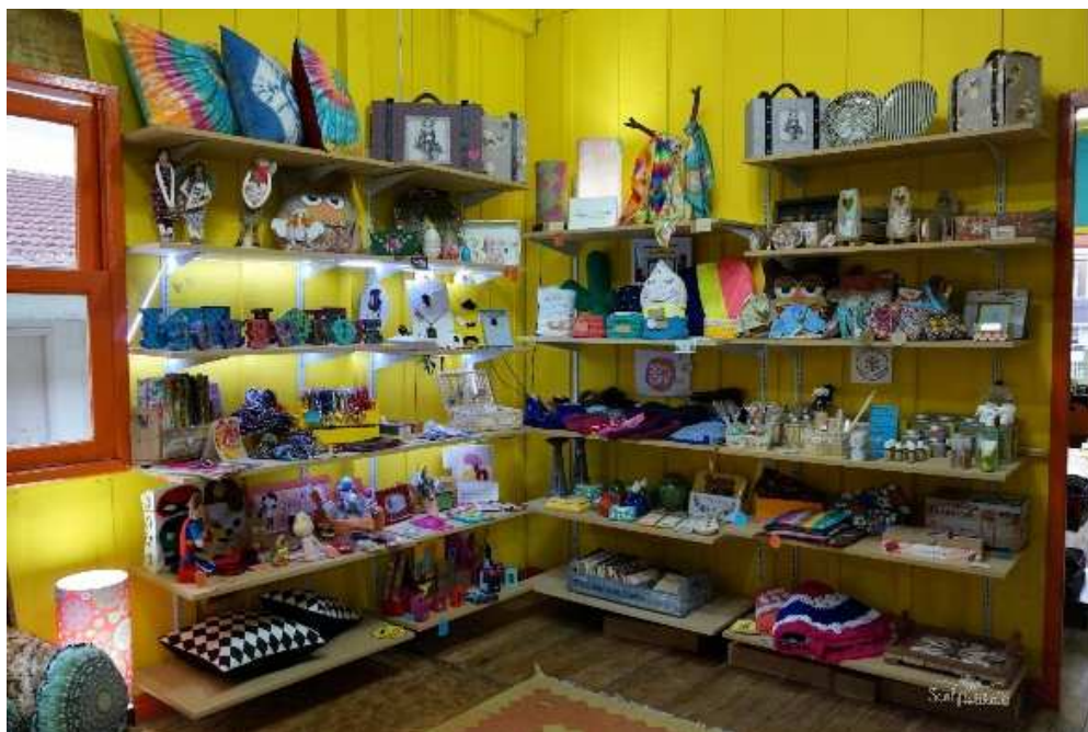
Figura 04 – Sala ao lado da entrada