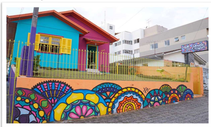
Figura 02: Frente da Bendita Colab