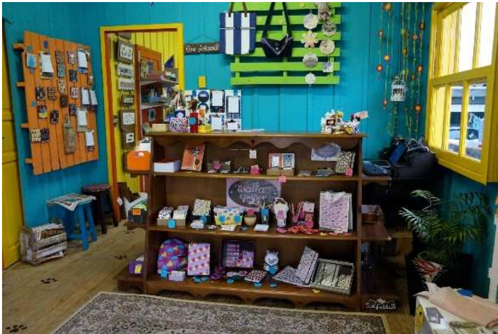
Figura 03: Sala de Entrada da Bendita