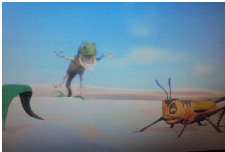
Figura 07: Calango ataca o grilo

2) As relações ecológicas entre as espécies em uma comunidade biológica são bem diversificadas. O filme “Calango”, o curta metragem, apresenta estas relações. Responda: