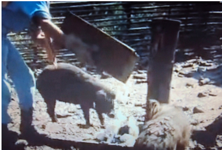
Figura 08: Lixo aos porcos

retrato desumano. Nas relações ecológicas, espécies distintas podem disputar alguns recursos em determinado ambiente. Observe a imagem e responda: