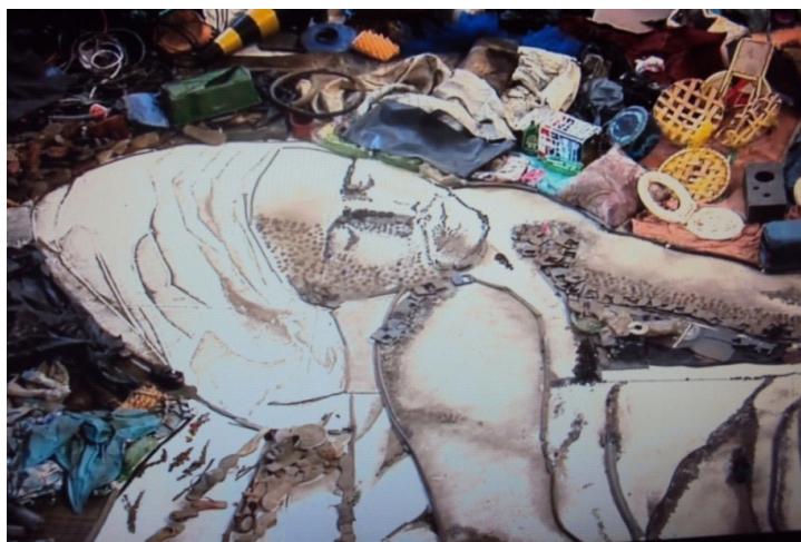
Figura 13: Resíduos transformados em arte

Fonte: Filme “Lixo Extraordinário”; Direção: Lucy. W, João. J, Karen. H; Produtora: Jackie de Botton; Distribuidora: Downtown Filmes, 2010.