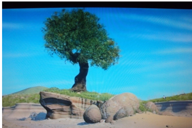
Figura 01: Ambiente onde se encontra o formigueiro no filme Vida de Inseto

2) No início do filme “Vida de Inseto”, aparece um cenário retratado pela imagem abaixo. Descreva este ambiente detalhando os aspectos bióticos e abióticos.