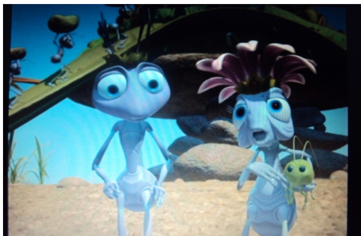
Figura 05: Divisão de trabalho no formigueiro

1) No planeta Terra existem vários ecossistemas. Nestes ambientes, a biodiversidade relaciona-se com o ambiente físico e entre si, formando as relações ecológicas. Estas ocorrem entre indivíduos da mesma espécie ou diferentes, na busca por água, espaço, alimento, abrigo, luz ou parceiros para reprodução. Os filmes “Bee Movie” e “Vida de Inseto”, retratam a divisão de trabalho de determinadas espécies que vivem em grupo. O primeiro, de uma colméia e o segundo, de um formigueiro, um tipo de relação harmônica. Com o auxílio das imagens abaixo, responda: