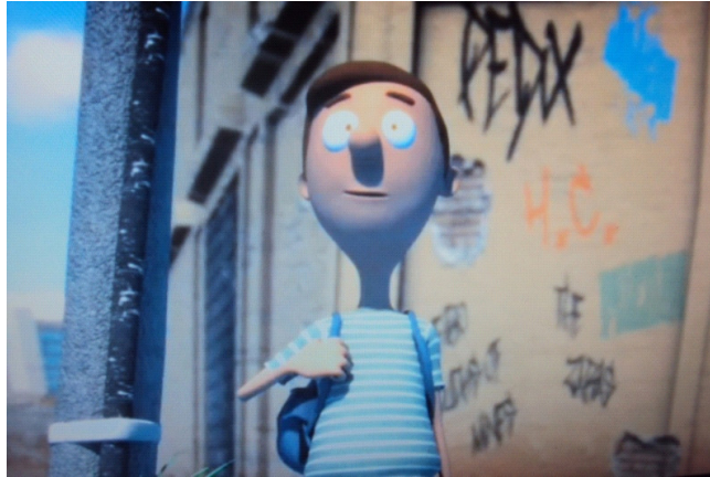
Figura 10: Imagem da cidade abordada no filme a “A Ilha”

2) O desenvolvimento da sociedade humana não se fez acompanhar do controle e planejamento adequados das grandes cidades, gerando muitos problemas sem soluções simples. Os problemas sociais causam impactos no ambiente e o filme “A Ilha” retrata bem estes impactos. Quais são eles? Que consequências podem ocasionar à espécie humana?