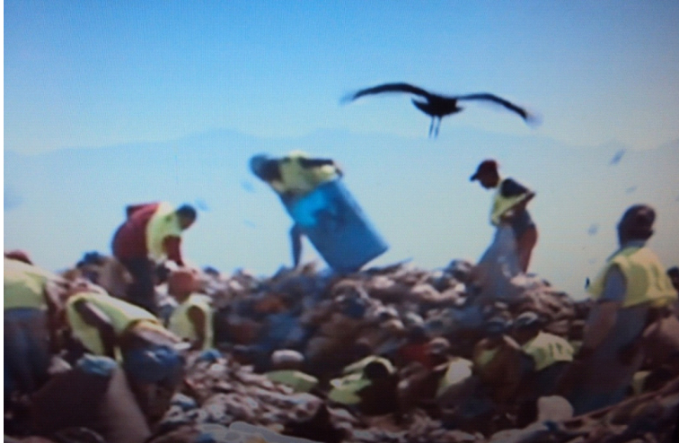
Figura 04: Local de descarrego do lixo urbano

6) No documentário “Lixo Extraordinário”, vemos retratado o “lixão” de uma cidade. Neste depósito de lixo, aparecem algumas aves voando sobre as pessoas e bicando o lixo. Observando a imagem abaixo, responda: