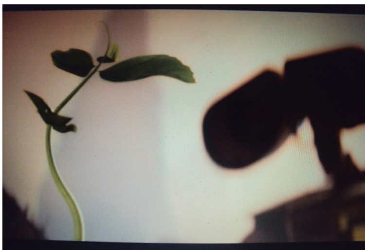
Figura 14: Planta encontrada pelo robô “Wall-E”

6) O filme “Wall-E” ilustra a violência no planeta Terra e o enredo relata alguns termos relacionados à sustentabilidade do planeta. Observe a imagem e responda: