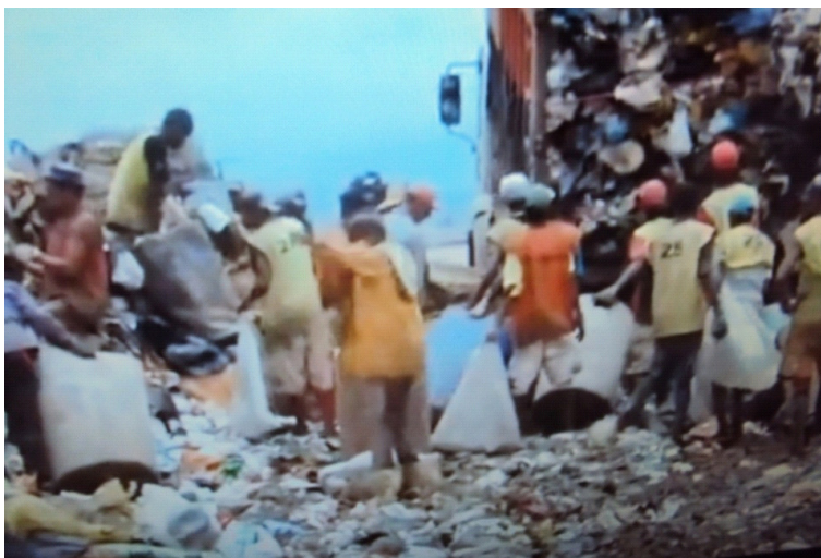
Figura 11: Descarregamento de lixo urbano no aterro Jardim Gramacho

Fonte: Filme “Lixo Extraordinário”; Direção: Lucy. W, João. J, Karen. H; Produtora: Jackie de Botton; Distribuidora: Downtown Filmes, 2010.