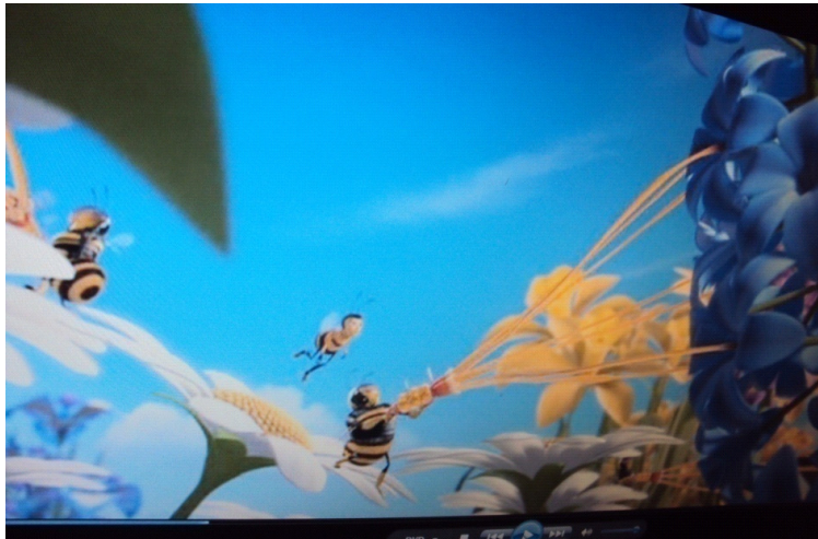
Figura 06: Abelhas operárias

Fonte: Filme “Bee Movie”, Direção: Steve Hickner, Simon J. Smith, Produtora: DreamWorks SKG, 2007.