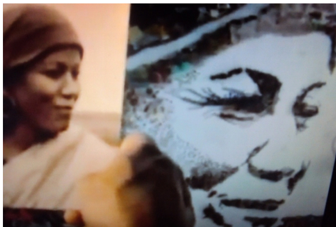
Figura 12: Resíduos transformados em arte

Fonte: Filme “Lixo Extraordinário”; Direção: Lucy. W, João. J, Karen. H; Produtora: Jackie de Botton; Distribuidora: Downtown Filmes, 2010.