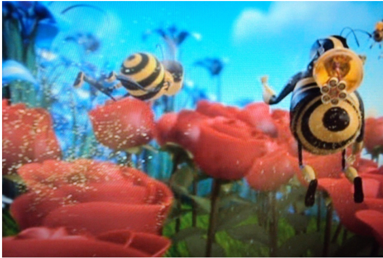
Figura 03: Entomofilia: Polinização por meio de insetos.

Fonte: Filme “Bee Movie”, Direção: Steve Hickner, Simon J. Smith, Produtora: DreamWorks SKG, 2007.