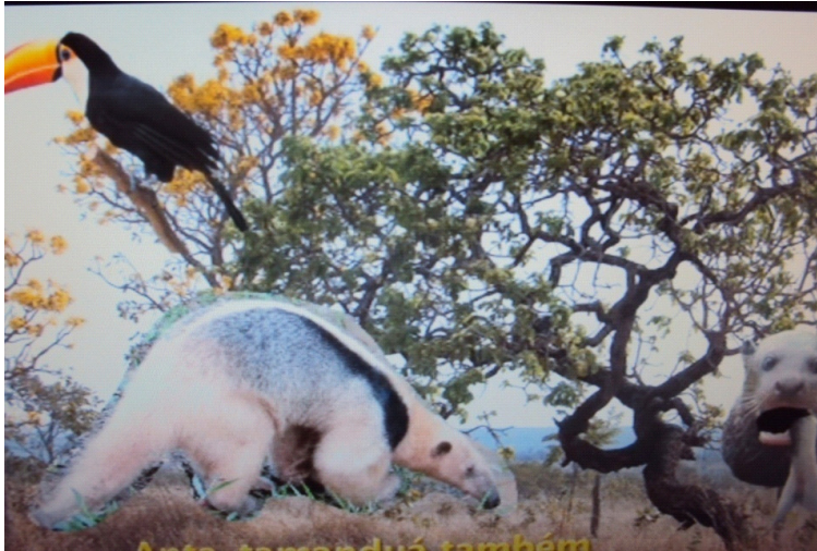
Figura 09: Característica de um cerrado

O filme “O quê que o Cerrado Tem?” enfatiza a caracterização da biodiversidade tanto de plantas como animais. Com o auxílio da imagem abaixo e do filme responda aos seguintes questionamentos sobre o cerrado brasileiro: